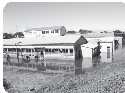
筑西市の工場の浸水の様子