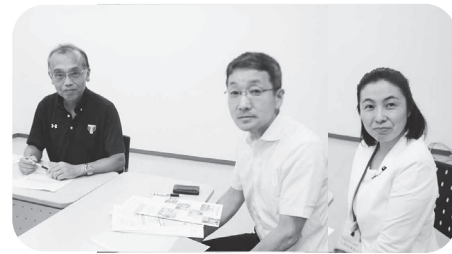
筑波大学体育学系の鍋倉教授に 川内校長先生と講師の相談