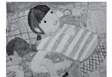
娘の桃がかいた絵です