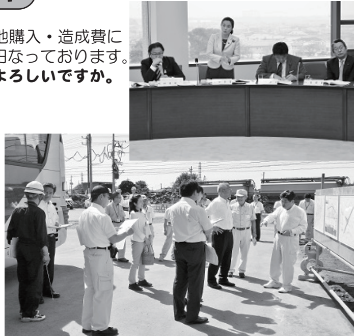
茨城県議会土木委員会で進捗状況の確認の様子