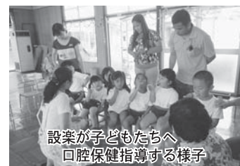
設案が子どもたちへ口腔保健指導する様子