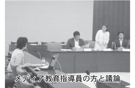
メディア教育指導員の方と議論

「平成25年度の子どものネット犯罪被害は15人に上り、そのうちの2人は小学生でした。児童買春・児童ポルノ禁止法違反にかかる被害も生じており、このような被害が二度と起こらないような対策が必要と考えます！」