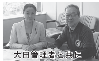
大田管理者と共に

健康プラザの大田管理者とシルバーリハビリ体操の指導士を増やすための意見交換会を実施。県立美術館や博物館などのチケットを特典とすることの方策について意見交換しました。