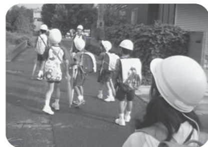
ヘルメットをかぶって通学中の小学生(下妻市)

ヘルメットは子どもたちの命を守るために大切です。子どもたちの理解の上でヘルメットが着用できるようにPTA連絡協議会と連携して活動中!!