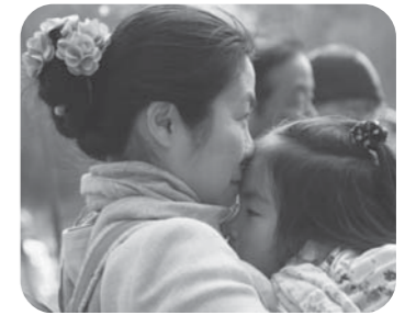
みんなで地域の子どもを育てましょう！

*いばキラTVでも取り上げられました。 http://youtu.be/n0eX29KTn1c