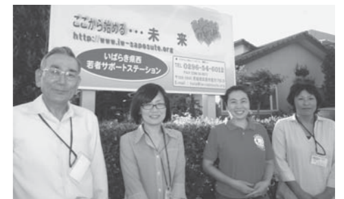
若者サポートステーションのスタッフの皆さんと

議員となり、ずっと提案し、活動してきたことが形になりはじめています。今後も、みなさんの雇用対策に力を注いでまいります。