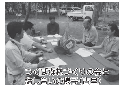
つくば森林づくりの会と話し合いの様子(古里)

それぞれの事業は、地域で団体を作り、農地や雑木林、そして河川域での活動を行います。 地域の1人1人の力が必要 です。これからも、この事業を通して地域の皆様を応援しステキなまちをつくりま