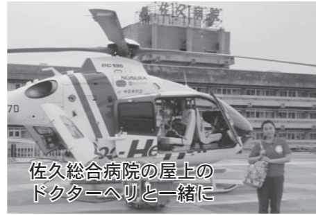
佐久総合病院の屋上のドクターヘリと一緒に

私は、筑西市民病院を急性期として、県西総合病院を慢性期として機能分担し、 地域医療再生計画に位置付け25億円の予算確保にむかって尽力 しています。