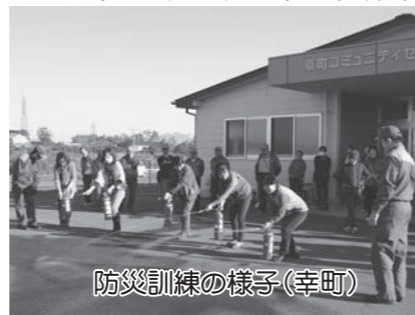
防災訓練の様子(幸町)

茨城県では、 自主防災組織結成促進事業費として969万円が予算化 されています。推進員2名(消防士0Bと防災士)を雇用し、結成への取り組みの働きかけや防災マップの作成の支援を行います。筑西市では、資機材購入費等(消火器・避難誘導時の旗や腕章)として 自治会に対して20万円 を限度に応援します。