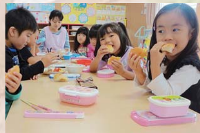
米粉パンを美味しく食べる子どもたち(竜巻被害で被災した苺ジャムをはさんで)

茨城県の就労継続支援B型事業所の1か月の工賃は10,684円。下から数えて3番目と低い状況です。今年6月には障がい者優先推進調達法が公布されました。これは、障がい者就労施設から優先的に物品を調達して需要の増進を図ろうとするものです。県や市町村は官公需を進めるために、部局横断的な対応が必要です。また、地域の皆さんの協力も重要です。