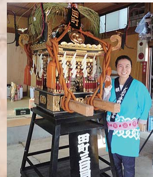
通称名と育まれた子ども神輿と一緒に

下館地区自治会が中心になり、「甲・乙・丙の住所表示はわかりにくい」という声が市民だけでなく、観光客からも多く聞こえてくることから、住所表示を通称町名に変更する署名を集めております。通称町名は、地域での祭りや戦時中の困難を乗り越えるために付けられた名前ではないかとされており、地元では愛着のある名称で普段より使われています。