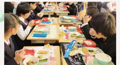
地産地消の給食を食べる中学生たち

今年9月の補正予算では、農林水産部から風評被害調査・払拭事業が提案され可決されました。県内の半分の市町村が対象になり、県産材の食材で給食を提供するために1食あたり200円が5日間にわたり補助される事業です。筑西市の下館給食センターも対象になり、11月15日～21日の5日間にかけて、茨城県の農産物を使った給食が提供されました。現在の学校給食は約30%の地産地消に留まっております。これからも、茨城の農業を守るために働いてまいります。