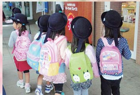
子どもたちの未来のために

筑西市では、市と協働でNPO法人地球の保健室が試験的にファミリーサポートセンターを立ち上げる準備をはじめています。地域全体で、子育てをする力をつくるのが大切になっています。